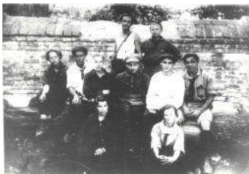
Первые пионервожатые, 1925 г.

В марте 1923 года в Воронеже состоялась 8-я Губернская комсомольская конференция, которая постановила приступить к организации в городе пионерских отрядов.