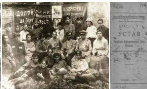
Делегаты I губернского съезда РКСМ

В истории воронежской комсомолии 1928 год отмечен выходом в свет первого номера газеты «Молодой коммунар» в качестве органа обкома ВЛКСМ Центрально-Черноземной области. Впоследствии «Коммунар» стал одной из лучших молодежных газет страны.