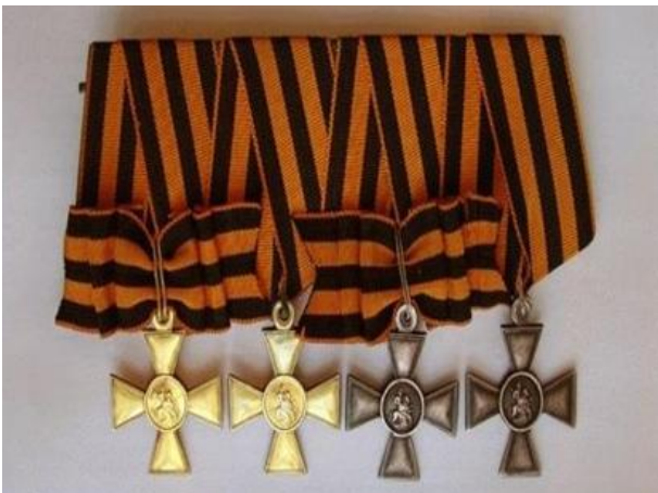
Орден Святого Георгия

Свою историю данный праздник ведет еще с XVIII века. Эта декабрьская дата приурочена к выдающемуся событию эпохи правления императрицы Екатерины II — в 1769 году она учредила орден Святого Георгия Победоносца. В те годы этим орденом награждались воины, проявившие в бою доблесть, отвагу и смелость. Орден Святого Георгия имел 4 степени отличия, из которых первая была наивысшей. Известно, что кавалерами всех четырех степеней стали 4 человека, среди которых великие русские полководцы М.И. Кутузов и М.Б. Барклай-де-Толли. Екатерина II удостоила и себя этой награды в честь учреждения ордена. До 1917 года в день памяти Святого Георгия (26 ноября по старому стилю) в России отмечался праздник георгиевских кавалеров. После Октябрьской революции 1917 года праздник, как и орден, были упразднены.